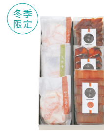
かぶら寿し・大根寿し・燻製スライスセット ¥6,426 (税抜 ¥5,950) KDS01 ○かぶら寿し(2個)／大根寿し(1個)／燻製スライスさば・ぶり・ふぐ(各1袋) ○冷蔵7日(かぶら寿し・大根寿し) 冷蔵2ヶ月(燻製スライス)