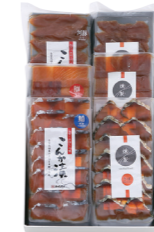
こんか漬・燻製スライスセット ¥6,048 (税抜 ¥5,600) SS01 ○こんか漬スライスさば・ぶり・ふぐ・燻製スライスさば・ぶり・ふぐ(各1袋) ○冷蔵2ヶ月