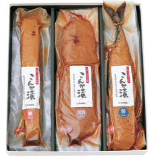
こんか漬セットD ¥4,868 (税抜 ¥4,507) F04 ○さば・ぶり・ふぐ(各1袋) ○冷蔵6ヶ月