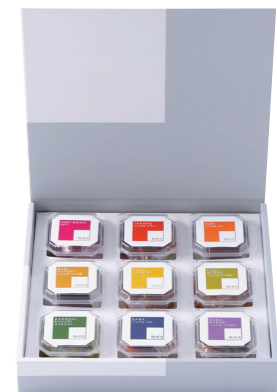
NoKA 9個セット ¥4,363 (税抜 ¥4,040) NoKA1059-1 内容: 梅干し・たらこ・ぶり・ぶり燻製・ふぐ・ふぐ燻製・辛子きゅうり・さば・さば燻製 ○冷蔵14日(辛子きゅうり) 冷蔵2ヶ月(こんか漬) 冷蔵6ヶ月(梅干し)