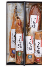
こんか漬セットB ¥3,788 (税抜 ¥3,507) F02 ○さば(半身)／ぶり・ふぐ・にしん・いわし(各1袋) ○冷蔵3ヶ月(さば半身) 冷蔵6ヶ月(その他)