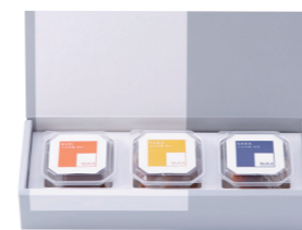
NoKA 3個セット ¥1,490 (税抜 ¥1,380) NoKA1058 内容: ぶり・ふぐ・さば ○冷蔵2ヶ月

自家製の米ぬかと米糲で漬けた石川の伝統食「こんか漬」などを食べやすくスライスし、1人前ずつ個食化しました。