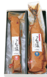
こんか漬セットA ¥3,410 (税抜 ¥3,157) F01 ○さば・ぶり(各1袋) ○冷蔵6ヶ月