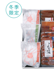
かぶら寿し・大根寿し・こんか漬スライスセット ¥6,264 (税抜 ¥5,800) KDS02 ○かぶら寿し(2個)／大根寿し(1個)／こんか漬スライスさば・ぶり・ふぐ(各1袋) ○冷蔵7日(かぶら寿し・大根寿し) 冷蔵2ヶ月(こんか漬スライス)