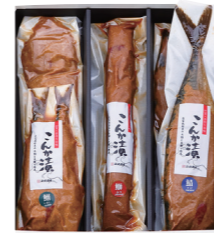
こんか漬セットE ¥6,327 (税抜 ¥5,858) F05 ○さば・ぶり・ふぐ・にしん・いわし(各1袋) ○冷蔵6ヶ月