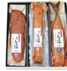
こんか漬セットC ¥4,220 (税抜 ¥3,907) F03 ○さば・ぶり・にしん(各1袋) ○冷蔵6ヶ月