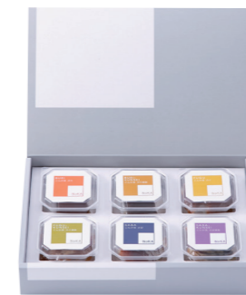
NoKA 6個セット ¥3,089 (税抜 ¥2,860) NoKA1059 内容: ぶり・ぶり燻製・ふぐ・ふぐ燻製・さば・さば燻製 ○冷蔵2ヶ月